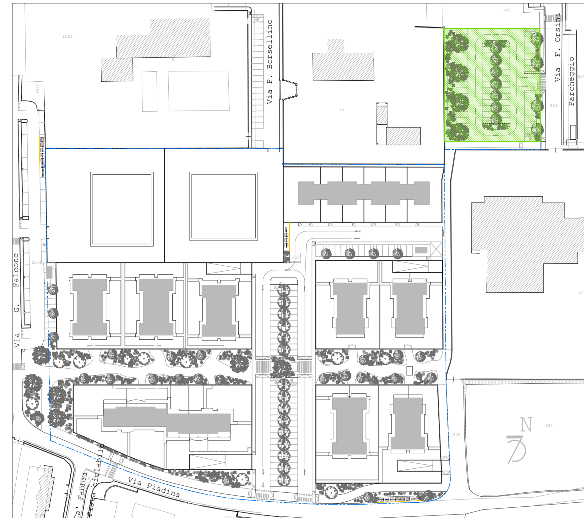
Individuazione intervento 1:1000

NOTA: Il presente elaborato è di natura progettuale e non ha valore di autorizzazione. Ogni violazione sarà perseguita ai sensi di legge.